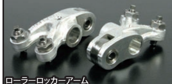
ローラーロッカーアーム