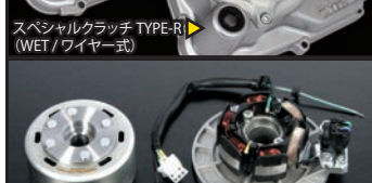
スペシャルクラッチ TYPE-R (WET/ワイヤー式)