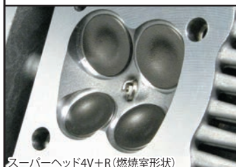
スーパーヘッド4V+R (燃焼室形状)

コンプリートエンジンは各パーツを適切な管理の上で組み立てたハイクオリティーエンジンです。