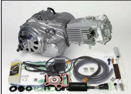
スーパーヘッド4V+Rコンプリートエンジン124cc セカンダリー式キックスターターシステムクランクケース スペシャルクラッチ TYPE-R DRY(乾式)/油圧式

※仕様変更について：下記エンジン仕様以外のエンジンの仕様変更は出来ません。予めご了承下さい。