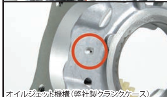
オイルジェット機構 (弊社製クランクケース)