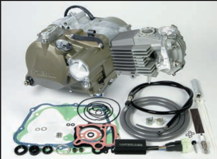
スーパーヘッド4V+Rコンプリートエンジン88cc プライマリー式キックスターターシステムクランクケース スペシャルクラッチ 5ディスク(湿式)/ワイヤー式