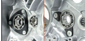
ベアリングホルルドプレート (弊社製クランクケース)