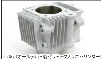
124cc (オールアルミ製セラミックメッキシリンダー)